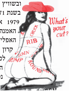
"מה הנתח שלך?" איור אמריקאי מלפני חצי-מאה. הפיכת בעלי-החיים לחתיכות בשר סוללת את הדרך לראיית "המין החלש", הנשים, כחתיכות בשר גם הן.

הפרדה גזעית בין שחורים ללבנים הייתה נהוגה במקומות מסוימים בארצות הברית (בתי-ספר, אוטובוסים, מסעדות ועוד) עד לפני כ-40 שנה, ומשטר האפרטהייד בדרום אפריקה נפל באופן סופי רק באמצע שנות ה-90. ארצות הברית העניקה לנשים זכות הצבעה בשנת 1920 (לשחורים זכות זו ניתנה בפועל רק ב-1965), ובשוויון זכות זו ניתנה רק בשנת 1971. כך, רק בשנת 1979 אימץ האו"ם את האמנה לביטול כל צורות האפליה נגד נשים. העיקרון המשותף והמנחה לכל מנגנוני הדיכוי הללו הוא שהאי-נטרס, ולו הקטן ביותר, של העליון, נתפס כנעלה על זכויותיו של השונה ממנו.