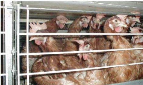
"כלובי סוללה". הצפיפות האיומה - מרחב של קופסת נעליים לכל תרנגולת - פירושה סבל בלתי נתפס מדי שעה ומדי דקה, עד ליום מותן. פניה האמיתיים של תעשיית הביצים

כאשר אנו מדברים על שוויון זכויות אנו מתכוונים לשוויון בחשיבות שאנו מעניקים לרצונות של פרטים שונים. כשם שבתוך המין האנושי אנו פוסלים אבחנות כגון צבע, מגדר, ארץ מגורים, מוצא, אמונה, נטייה מינית, גיל או רמת אינטליגנציה כקובעות זכויות או כבסיס