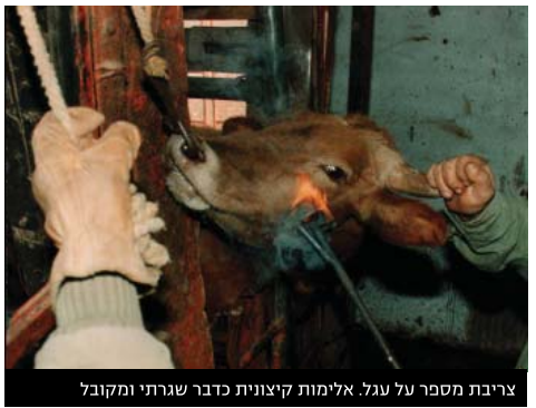
צריבת מספר על עגל. אלימות קיצונית כדבר שגרתי ומקובל

מ עטים מאוד יתנגדו לקביעה כי החברה בה אנו חיים מבוססת בחלקה הגדול על אלימות. אלימות זו, כחלק מתרבותנו ולמעשה עצם קיומנו, הינה ללא ספק בעלת השפעה עמוקה על כולנו. מבט ביקורתי על החברה בה אנו חיים מראה כי קיימות בה לא מעט קבוצות המדוכאות, קבוצות שלעתים קרובות אף סובלות מיחס אלים כלפיהן, וביניהן נשים, מהגרי עבודה, הומואים ולסביות, נכים, ילדים ומשפחות חד הוריות. קבוצה נוספת שלא ניתן לנתקה משאר הקבוצות המדוכאות היא קבוצת בעלי-החיים. למעשה, קבוצה זו היא המדוכאת ביותר בחברה שלנו - זו שהפגיעה בה נתקלת בשתיקה הרועמת ביותר ובאדישות הגדולה ביותר, וזו הסובלת מאלימות קיצונית כחלק משגרת היומיום. בעלי-החיים