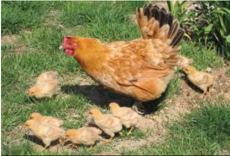
תרנגולת ואפרוחיה חובשים, בטבע. שלל צרכיהם הבסיסיים ביותר, פיזיים ונפשיים, נמנעים מהם עם כליאתם במשקים המתועשים

וגם לא בשיטות הנהוגות בה (כהשלכת אפרו- חים בני יומם לפחי אשפה בתעשיית הביצים, או כליאת עגלים בתיבות שבהם הם אינם יכו- לים אפילו להסתובב, בתעשיית עגלי החלב). שורש הבעיה הוא שבעלי-חיים נתפסים כרכוש ואמצעים למטרות של בני-האדם, ולא כיצורים שיש להם צרכים ומסוגלים לחוש כאב וסבל. ובעיה זו לא ניתן לפתור על-ידי חיפוש שיטות אכזריות פחות לגידול ולהמתה.