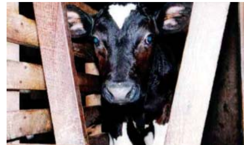
עגלי חלב מופרדים מאימותיהם כ-24 שעות לאחר שנולדו, ומבלים את חייהם הקצרים בארגזי עץ צרים, ללא יכולת לנוע או להסתובב, כדי שבשרם האנמי יישאר לבן ורך. אכזריות ללא גבולות

בעלי-החיים במשק המתועש נולדים לתוך עולם של כאב וסבל: האפרוחים בוקעים במ- דגרות חשוכות, העגלים נקרעים מאמם מיד לאחר ההמלטה, התרנגולות נדחסות בכלובים צפופים, וכו'.