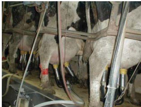
מכון חליבה מתועש. הדחף לרווחיות הופך את גופה של הפרה למכונה לייצור חלב, על חשבון רווחתה, בריאותה, חירותה ואף חייה עצמם.

בהם הן אינן יכולות אפילו לפרוס את כנפיהן, האווזים מפוטמים בכח על ידי החדרת צינור לגרונם - ואלו הן רק דוגמאות מעטות. לא רק שנשללים מבעלי-החיים צרכים בסיסיים כהג- נה, חום, אהבה, משפחה, אוויר צה, מזון ומים, אלא גם מכים אותם, דוחקים בהם, מבודדים אותם, מטילים בהם מזומים, מזריקים להם מיני סטרואידים בכדי לקצר את הזמן הדרוש לגדלם, מותירים אותם לחיות בצואה ובשתן של עצמם ומזריקים להם כמויות גדולות של אנטיביוטי- קה על מנת שיחזיקו מעמד עד השחיטה.