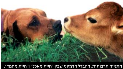
התנייה תרבותית. ההבדל הדמויני שבין "חיית מאכל" ו"חיית מחמד"

התעשיות האכזריות אינן קיימות ממניעים אלימים אלא משיקולים כלכליים קרים של הפקת רווחים. היצרנים שמרוויחים מהסבל של בעלי-החיים ומקדישים אמצעים רבים כדי להסתירו מעיני הציבור, היו רוצים שתאמינו שבתור יחידות ויחידים בחברה אין לכם את היכולת לשנות את המערכת. המציאות מוכיחה אחרת - אחד הכוחות הכי חזקים שלנו הציבור הוא חרם צרכנים על מוצרים שלפי דעתנו לא צריך לייצר.