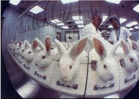
מדענים מתכננים לטפח חומצות ורעלים אל תוך עיניהן של ארנבות. מדי שנה עוברים מאות מיליוני בעלי-חיים ייסורי תופת במעבדות ניסויים ברחבי העולם, כולל בישראל, בה אין למעשה כל פיקוח בנושא

ביותר מבחינה כמותית וזה שדרגת הדיכוי שלו מגיעה לדרגות הקיצוניות ביותר. בעול-מנו, הקבוצה המדוכאת ביותר עלי אדמות היא בעלי-החיים.