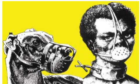
השוואה. מתקן ריסון של עבד אמריקאי מן המאה ה-18 אל מול מתקן ריסון של עבד ממין ביולוגי אחר - הכלב. ראיית העולם המשעבדת את החלש לרצונות החזק מוטעת מן היסוד, בעבר כמו גם בהווה.

במהלך אלפי שנים האמינו בני האדם כי קיימים מגזרים העליונים על אחרים - הגבר עליון על האישה, האדם הלבן עליון על האדם השחור וכו'. צורות דיכוי אלה היו כה מובנות מאליהן עד שאיש כמעט לא זיהה את עצם קיומן כסוג